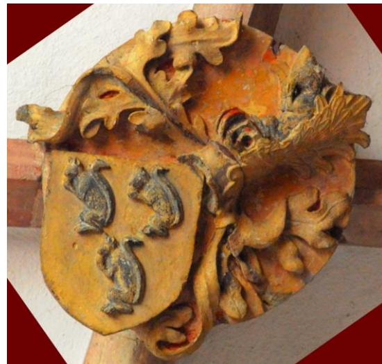
Stifterwappen der waldeckchen Herren von Wolmershausen; deutlich erkennbar sind drei Eichhörnchen, die Nüsse knabbern.