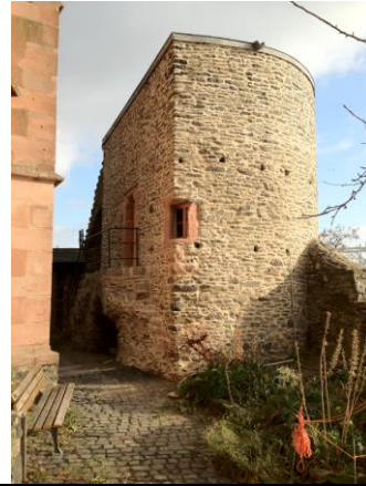
Der Stadtturm im Justinusgarten. Hier entsteht bis Mai eine kleine Ausstellung, die an das Wirken der Höchster Antoniter erinnern soll.