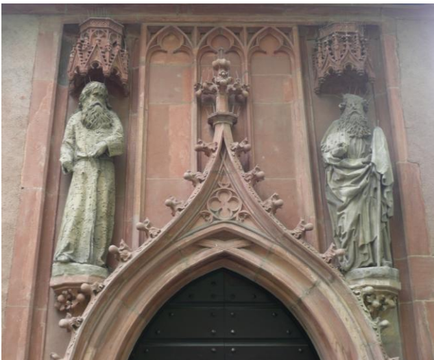
Die „angeschlagenen“ Einsiedler Paulus von Theben (links) und Antonius der Große (rechts) (Kopien; die Originale sind seit 1966 in der Kirche)