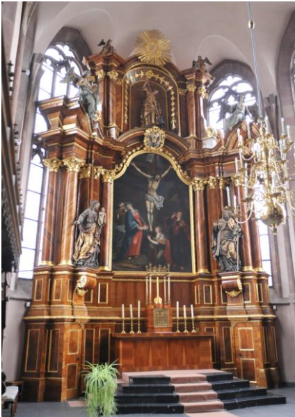
Der barocke Hochaltar, der größte Furnieraltar des Bistums Limburg, ist zur Zeit eingerüstet.