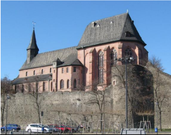
Die Justinuskirche in Höchst, hoch über der Stadtmauer; rechts im Bild der inzwischen restaurierte Eckturm der ersten Stadtbefestigung